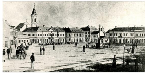
Szent István tér kb.1832-ben

Az 1900. évek elejétől fellelhető fotóknak már ismertek a készítői.