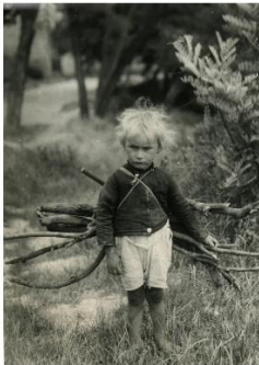
Fát gyűjtő gyermek - 1935.

Az 1900. évek elejétől fellelhető fotóknak már ismertek a készítői.